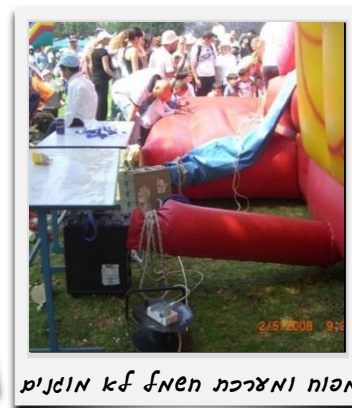
מפוח ומצרכת חשמל מסוכנים