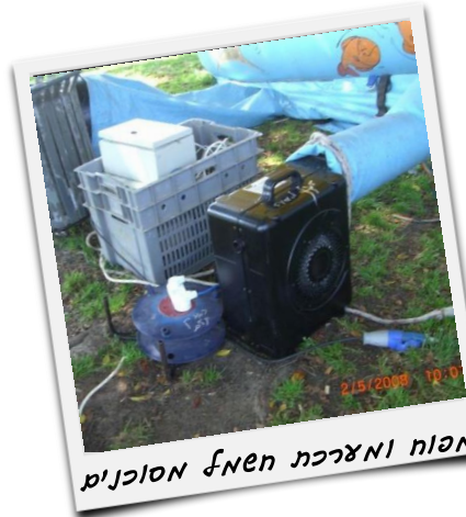
מפוח ומצרכת חשמל מסוכנים

7. חשמל : תשומת לב מיוחדת תינתן לפריסת כבלי החשמל, באופן שלא יסכנו את הילדים: